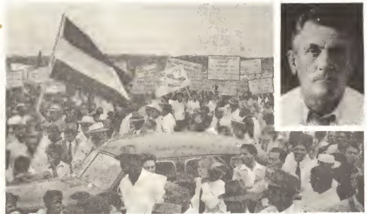
Riba e foto aki nos ta haya un vista di e deseo ferviente cu ta reina den corazon di tur Arubiano pa cu nan patria, den un demonstracion masaal cu a tuma lugar na Aruba, unda miles di votador a demostrá y expresá nan deseo di kier dirigi destino di nan propio Isla.

Pa motibo cu Gobierno Central tin intencion di comete e infraccion aki riba nos sistema autonomo, Eilandsraad di Aruba cu TUR derecho den un tenida publica fecha 22 di november 1967 a duna di conoce cu Aruba ta existi mas autonomía.